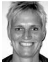
Velkommen til Ulla