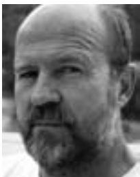
Farvel til den gamle redaktør

Først i det nye år vil man kunne tilmelde sig det nye elektroniske månedsbrev på www.sfi.dk .