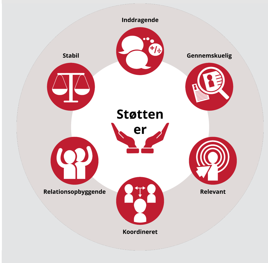
Figur 3.1 De seks faglige principper